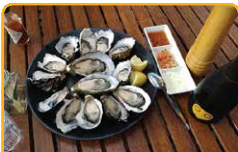
品尝塔州最美味的生蚝 Oyster Farm*

早餐后，穿过霍巴特市区南行，抵达轮渡码头 乘坐轮渡 20 分钟后抵达布鲁尼岛 Bruny Island by ferry ，沿着海岸线行驶，穿梭于森林间，前往著名的 南北一线 The Neck ，这条狭长的小径，如同细线一般将布尼岛的南部和北部链接起来，两侧都是一望无际的大海。这里也是企鹅归巢的栖息地。