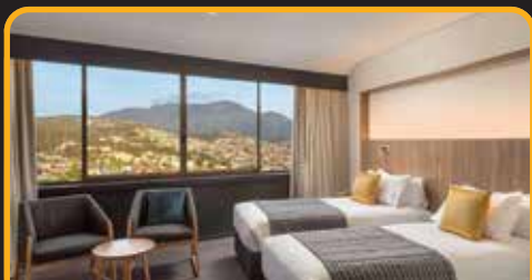
4.5星酒店: Wrest Point Hotel 或同级