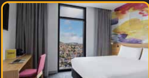
4星酒店: Ibis Styles Hotel 或同级