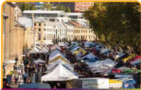
萨拉曼卡广场 Salamanca Place