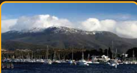
南天第一峰: 惠灵顿山 Mt Wellington