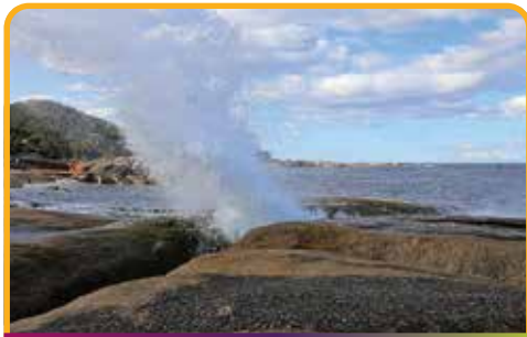
喷水洞 Blow Hole