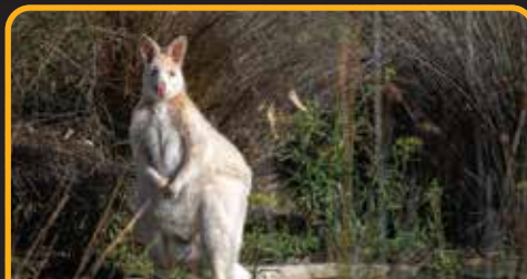
布鲁尼岛独有的白色袋鼠 White Kangaroo