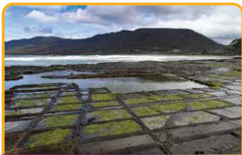
棋盘道 Tessellated Pavement