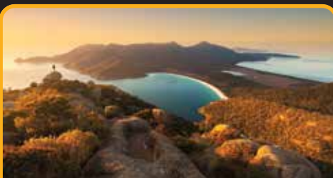
酒杯湾 Wineglass Bay