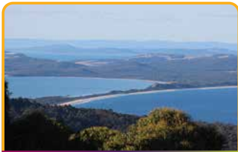
布鲁尼岛南北一线 The Neck

但是 酒杯湾 Wineglass Bay 坐落在群山之中，美丽不外露，游客们必须登高，花费一番力气之后才领略到她的美丽。途中停靠美丽的滨海小镇 斯旺西 Swansea ，从不同角度全方位欣赏塔斯马尼亚东海岸，从不同角度全方位欣赏塔斯马尼亚东海岸的美景。