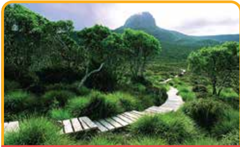
摇篮山 Cradle Mountain

早餐后, 前往塔斯曼半岛 亚瑟港监狱遗址*(自费) Port Arthur* (at your own expense) , 这里是殖民地时代流放罪犯的遗址, 已被联合国教科文组织列入世界遗产。南半球最大的监狱, 依山傍海, 没有围墙, 以及海景牢房, 绝对会颠覆你对监狱固有的印象。回程途中, 我们还将游览 喷水洞 Blow Hole 、 塔斯曼拱门 Tasman Arch 、 棋盘道 Tessellated Pavement 和 魔鬼厨房 Devil's Kitchen 等当地著名旅游景点。