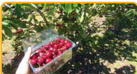
采摘车厘子 Cherry Picking*