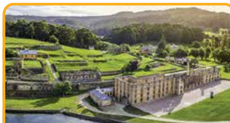
亚瑟港监狱遗址 Port Arthur*