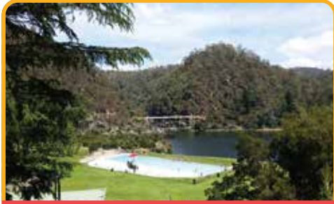
凯德奈特大峡谷 Cataract Gorge

酒杯湾在 1999 年由美国旅游杂志《Outside》投选酒杯湾为世界十大海滩, 但是 酒杯湾 Wineglass Bay 坐落在群山之中, 美丽不外露, 游客们必须登高, 花费一番力气之后才领略到她的美丽。途中停歇美丽的滨海小镇 斯旺西 Swansea , 从不同角度全方位欣赏塔斯马尼亚东海岸。