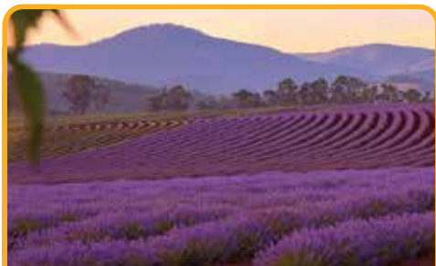
飘丝薰衣草庄园 Lavender Estate*

Note: Solo traveller have to pay a single supplement. Child <12 utilising existing bedding with breakfast.