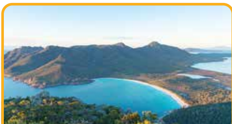
酒杯湾 Wineglass Bay