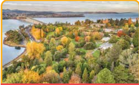
皇家植物园 Royal Botanical Gardens

早餐后, 前往 瑞士文化度假村 Swiss Village 散步。接下来去到 凯德奈特大峡谷 Cataract Gorge , 偶尔会有色彩斑斓的孔雀、沙袋鼠出现。 乘坐世界上最长的单跨缆车(自费) Sky Ride* (at your own expense) 。午餐后, 前往 塔马湿地公园 Tamar Island Wetlands , 是一座位于 塔马河 River Tamar 上的小岛, 是重要的鸟类栖息地。返回霍巴特的途中, 经过 罗斯小镇 Ross , 这就是宫崎骏《魔女宅急便》的最初构想地。不妨到魔女小琪打工的地方 - 罗斯面包店 Ross Bakery 里来一份刚出炉的面包哦。(朗塞斯顿离开则不经过 Ross 小镇)