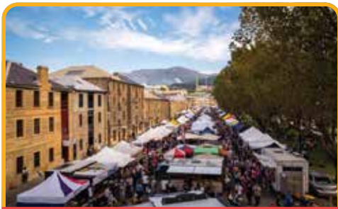
萨拉曼卡广场 Salamanca Place