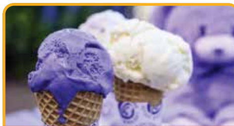
飘丝薰衣草庄园 Lavender Estate*