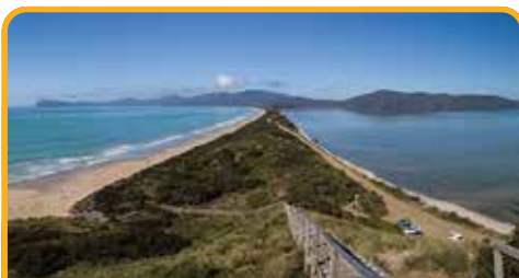
布鲁尼岛南北一线 The Neck