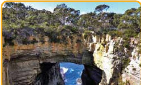
塔斯曼拱门 Tasman Arch

返回霍巴特的途中, 经过 罗斯小镇 Ross , 绿色的尖屋顶, 映衬在高大的橡树、榆树和针叶树影中, 这就是宫崎骏《魔女宅急便》的最初构想地。不妨到魔女小琪打工的地方 - 罗斯面包店 Ross Bakery 里来一份刚出炉的面包哦。(朗塞斯顿离开则不经过Ross小镇)