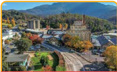
啤酒厂 Cascade Brewery