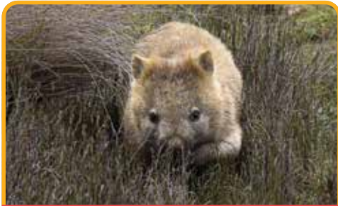
偶遇憨态可掬的袋熊 Wombats

酒杯湾在 1999 年由美国旅游杂志《Outside》投选酒杯湾为世界十大海滩, 评论如此描述:“沙滩与塔斯马海形成轮廓分明的半月形状, 犹如“祝君愉快”扣钮上的笑脸一般……”但是 酒杯湾 Wineglass Bay 坐落在群山之中, 美丽不外露, 游客们必须登高, 花费一番力气之后才领略到她的美丽。途中停靠美丽的滨海小镇 斯旺西 Swansea , 从不同角度全方位欣赏塔斯马尼亚东海岸。