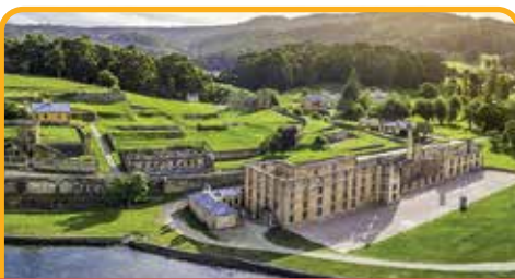
亚瑟港监狱遗址 Port Arthur*