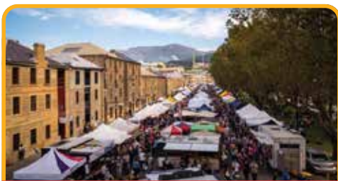
萨拉曼卡广场 Salamanca Place