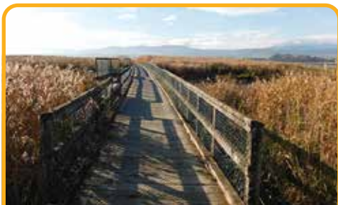
塔马湿地公园 Tamar Island Wetlands