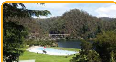
凯德奈特大峡谷 Cataract Gorge