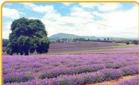
飘丝薰衣草庄园 Lavender Estate*