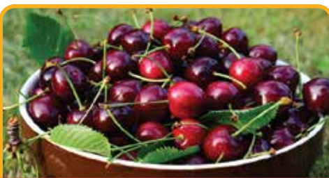
采摘车厘子 Cherry Picking*