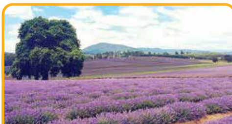
飘丝薰衣草庄园 Lavender Estate*