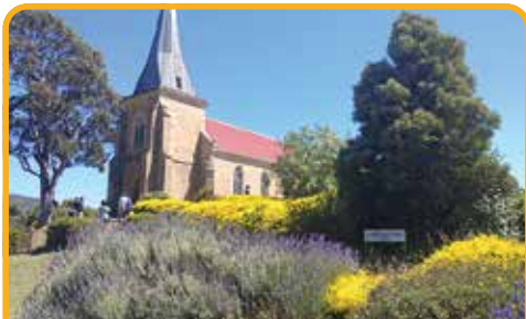
里奇蒙古老的天主教堂 Richmond