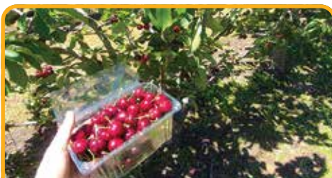
采摘车厘子 Cherry Picking*