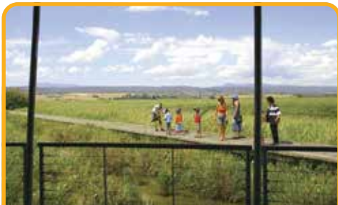
塔马湿地公园 Tamar Island Wetlands