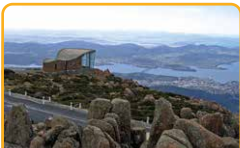
南天第一峰: 惠灵顿山 Mt Wellington