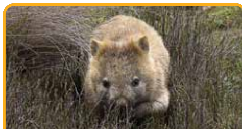
偶遇憨态可掬的袋熊 Wombats