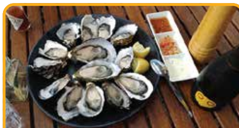
品尝塔州最美味的生蚝 Oyster Farm*