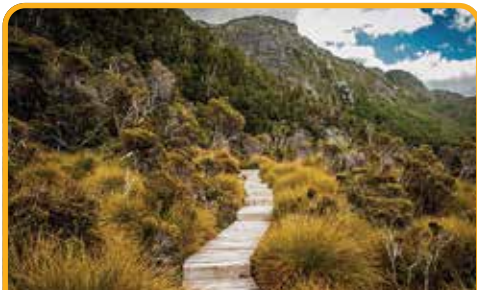
摇篮山 Cradle Mountain