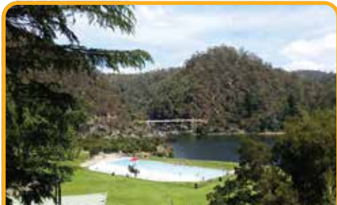
凯德奈特大峡谷 Cataract Gorge

早餐后, 前往 壁画之镇 - 谢菲尔德 Sheffield , 小镇的ATM取款机、唱片店、咖啡馆、餐厅, 就连荒废的房子上都被壁画装扮的浪漫又梦幻! 来到 摇篮山 Cradle Mountain , 沿着 鸽子湖 Dove Lake 的进行一小段徒步。一路上, 邂逅摇篮山的古老植被露兜树和水青冈, 偶遇憨态可掬的袋熊 Wombats 。