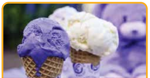
飘丝薰衣草庄园 Lavender Estate*