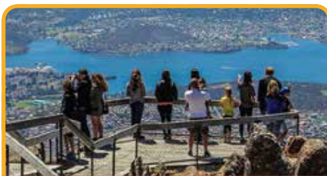
南天第一峰：惠灵顿山 Mt Wellington

4.5星参考酒店： Crowne Plaza Hotel/ Wrestpoint 或同级