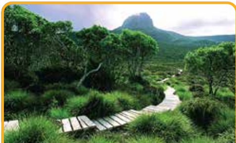
摇篮山 Cradle Mountain

早餐后, 前往 皇家植物园 Royal Botanical Gardens 散步, 欣赏花团锦簇的美丽景致。前往 菲尔德山国家公园 Mt Field National Park 。拥有着小岛不常见的瀑布群, 漫步世上少有的温带雨林, 参观著名的 罗素瀑布 Russell Falls 和 马蹄瀑布 Horseshoe Falls 。