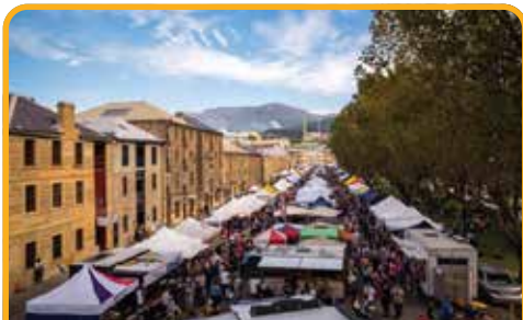
萨拉曼卡广场 Salamanca Place