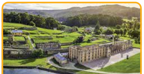
亚瑟港监狱遗址 Port Arthur*