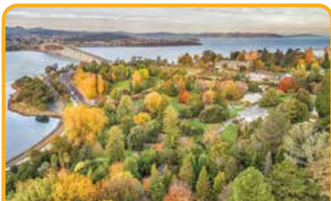
皇家植物园 Royal Botanical Gardens

早餐后, 前往 瑞士文化度假村 Swiss Village 散步。接下来去到 凯德奈特大峡谷 Cataract Gorge , 偶尔会有色彩斑斓的孔雀、沙袋鼠出现。 乘坐世界上最长的单跨缆车 (自费) Sky Ride* (at your own expense) 。午餐后, 参观 飘丝薰衣草庄园* (自费, 12月中-1月中) Bridestowe Lavender Estate* (at your own expense, mid Dec to mid Jan) 。可以尝尝薰衣草冰淇淋和薰衣草布朗尼。非薰衣草季节, 前往 塔马湿地公园 Tamar Island Wetlands , 是一座位于 塔马河 River Tamar 上的小岛, 是重要的鸟类栖息地。返回霍巴特的途中, 经过 罗斯小镇 Ross , 这就是宫崎骏《魔女宅急便》的最初构想地。不妨到魔女小琪打工的地方 - 罗斯面包店 Ross Bakery 里来一份刚出炉的面包哦。(朗塞斯顿离开则不经过Ross小镇)