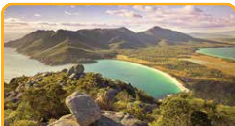
酒杯湾 Wineglass Bay