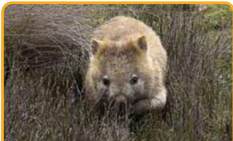
偶遇憨态可掬的袋熊 Wombats