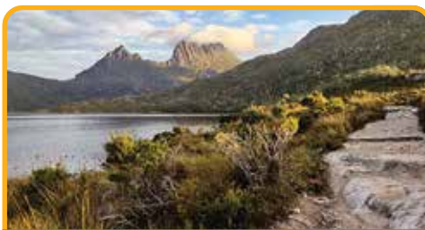
摇篮山 Cradle Mountain