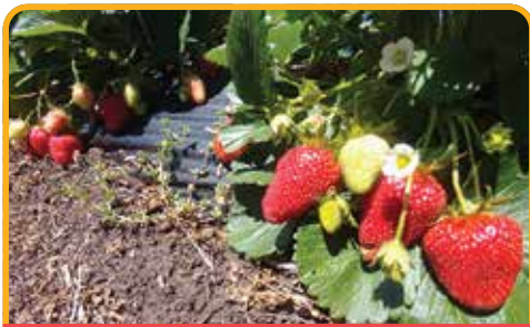
索雷尔果园 Sorell Fruit Farm*