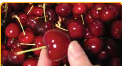
采摘车厘子 Cherry Picking*